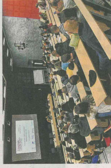
Éducateur spécialisé, assistante social, personnel de l'administration pénitentiaire... Plus de 150 personnes ont suivi la conférence.

« Il n'y a qu'un moyen, c'est de connaître la personne, savoir ce qui se passe dans sa tête, ce qu'elle ressent. Pour cela, il faut développer une bonne relation, avec son enfant, ou avec le jeune que l'on suit comme éducateur. » ■